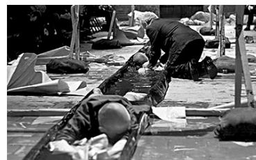
Scena Plastyczna KUL / Leszek Mądzik, Lublin » Bruzda «

05. – 08. Nov. // Penelope Wehrli & Detlev Schneider , Berlin // » Transforming Acts « // Ein TANZFONDS ERBE Projekt – Videokaleidoskop (Eintritt frei)