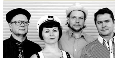
Die Band mjuix, Leipzig