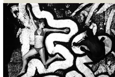
Compagnie Philippe Saire, Lausanne » Black out «