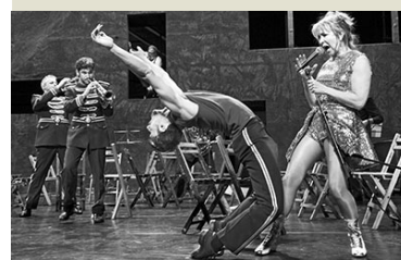
NTGent & les ballets C de la B / Alain Platel & Frank Van Laecke, Gent » En avant, marche! «