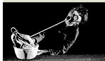
Compagnie Mossoux-Bonté, Brüssel » Kefar Nahum «