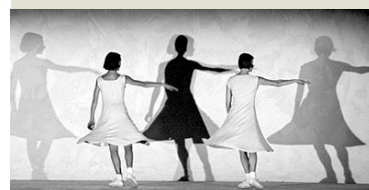
Szene aus Film »Fase«