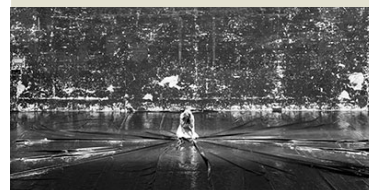
Societas Raffaello Sanzio / Romeo Castellucci, Cesena » Schwanengesang D 744 «