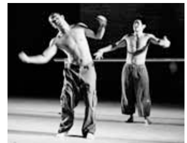
E-Motion, Düsseldorf, »2nd ID«

Erstmals besitzt das Festival eine eigene Kartenverkaufsstelle. Diese befindet sich ab 27.09.2008 im Café-Restaurant Telegraph am Dittrichring, in dem sich auch das neue Festivalcafé befinden wird.