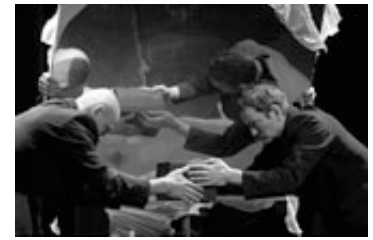
Centre chorégraphique national d'Orléans / Josef Nadj, »Entracte« (»Pause«), Festivaleröffnung