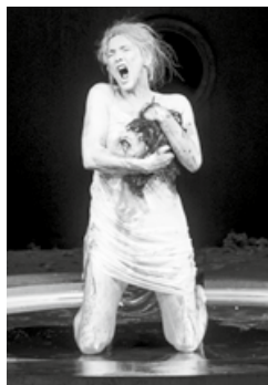
Marlis Petersen als Salome